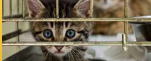
Molse dierenasielen krijgen Vlaams geld (p. 2)