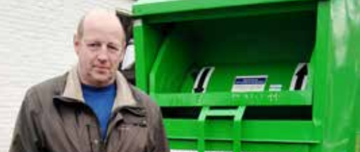
Kledingcontainers verdwijnen uit straatbeeld (p. 3)