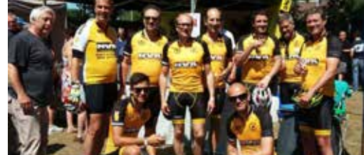
N-VA Mol deed mee met 1000 km p.3