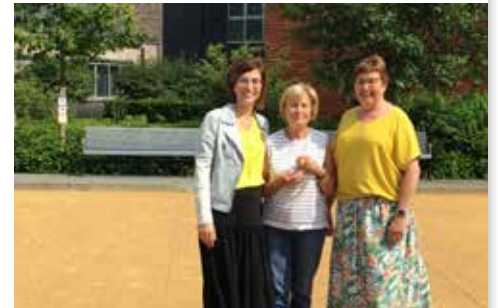
▲ Bij mooi weer genieten we samen van de vernieuwde petanquebanen.

“Wat me meteen opviel, is dat we zeer sterke adviesraden hebben voor de beleidsdomeinen senioren en personen met een beperking. Ze leveren inhoudelijk heel goed werk en ik ervaar er de kracht van positieve samenwerking. Intussen trekken we samen met de seniorenraad en de sportraad volop de beweegkaart via het project ‘Lekker Actief’. Voor senioren is blijven bewegen van kapitaal belang. Het geeft je een goed gevoel en helpt je een goede lichamelijke en mentale conditie te behouden. Zo blijf je langer zelfredzaam.”