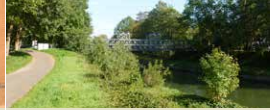
Mol wordt toeristische topper (p. 3)