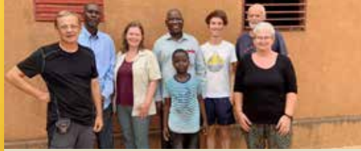
Bezoek aan Kara Kara (p. 2)